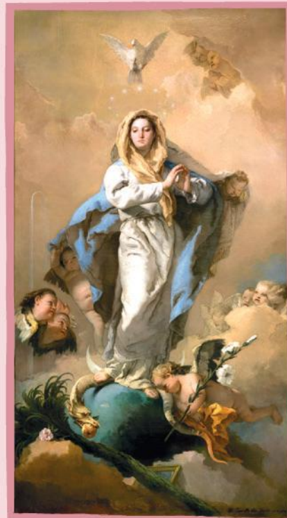
Inmaculada Concepción, 1767-69 G. TIEPOLO. Museo del Prado

«que en todo tiempo y lugar tendremos, profesaremos y defenderemos que la natural y verdadera concepción de purísima Virgen María fue limpia y santa y preservada de toda culpa y mancha de pecado original, y que, de ni palabra ni por escrito ni de otra manera, diremos ni enseñaremos lo contrario ni lo permitiremos, antes bien procuraremos continuando lo que nuestros predecesores, siguiendo las pisadas de los serenísimos reyes de Aragón siempre han hecho, que esto vaya en aumento y que los fieles cristianos sean instruidos e informados en tan santa, pía y loable doctrina y que siempre así lo tengan y defiendan».